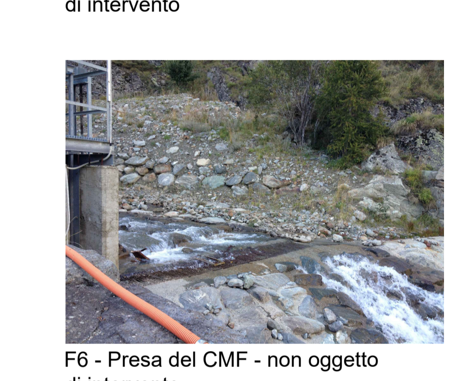
F6 - Presa del CMF - non oggetto di intervento