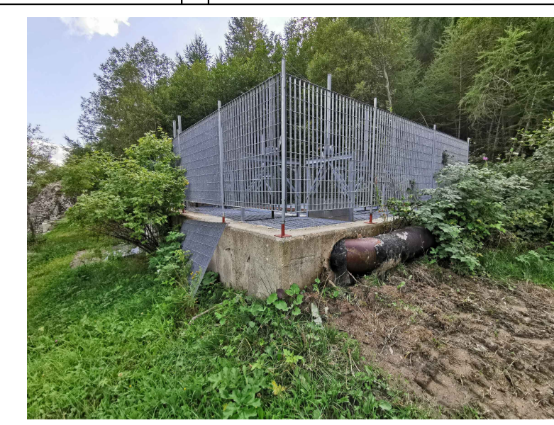
F1 - Vasca esistente, ingresso condotta