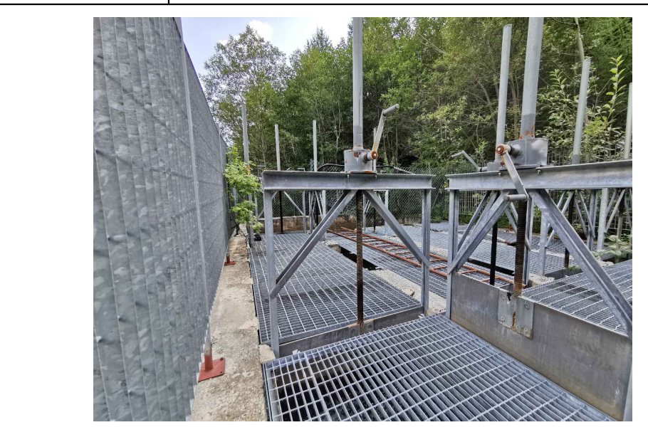
F4 - Vasca esistente, dissabbiatore