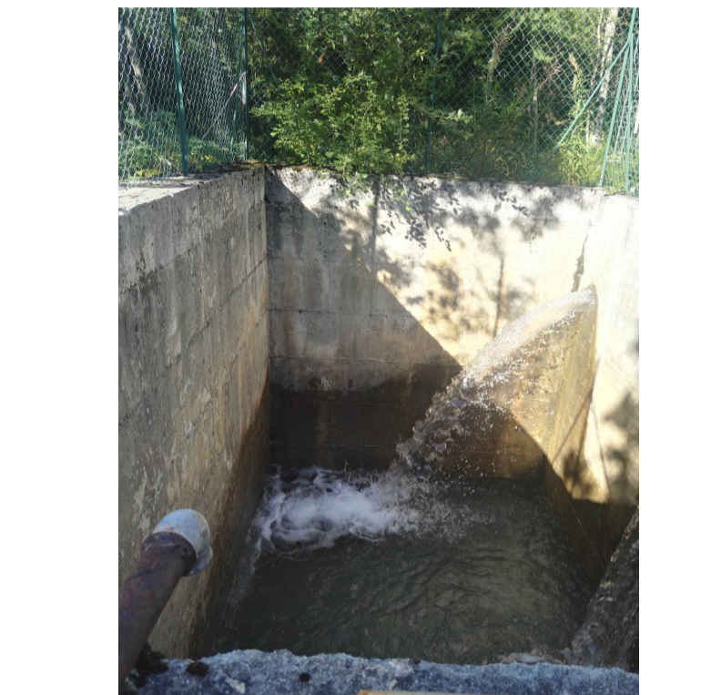
F3 - Vasca di carico esistente