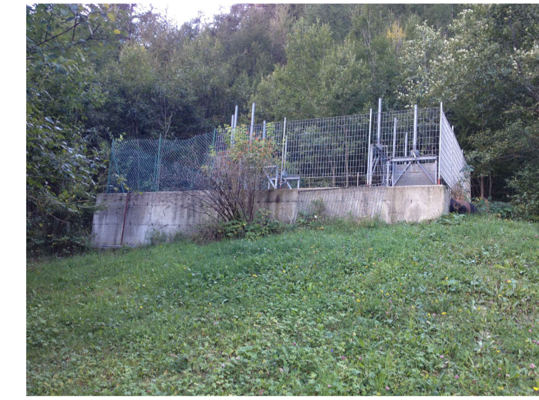
F2 - Vasca esistente, prospetto est