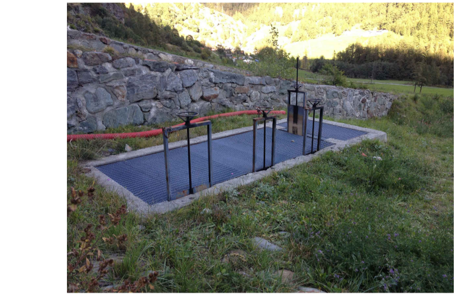
F5 - Pozzetto esistente - non oggetto di intervento